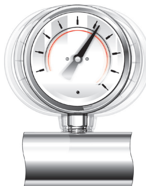
Figura 4. Las vibraciones excesivas pueden dañar los componentes del manómetro, provocando el fallo, y frecuentemente se reflejan en un manómetro que vibra visiblemente o en que la lente ha saltado.