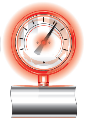
Figura 5. La decoloración es un síntoma de que el exceso de calor está dañando el manómetro. Esto puede significar que el manómetro está instalado en un lugar no óptimo o que no es adecuado para la aplicación.