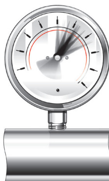
Figura 3. Puntero que fluctúa es un indicador común de que existe una pulsación excesiva que interfiere con la capacidad del manómetro de ofrecer una buena lectura. También puede provocar el fallo total del manómetro.