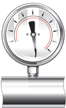
Figura 1. Un manómetro inadecuado para la aplicación se verá sobrepasado por la presión, con el puntero clavado en el tope mecánico.

pico inesperado en la presión del sistema, donde el pico ha hecho que el puntero golpee con fuerza el pasador de tope. Estos picos suelen estar provocados por el encendido o apagado de una bomba, o por una válvula que se ha abierto o cerrado aguas arriba de la válvula de presión.